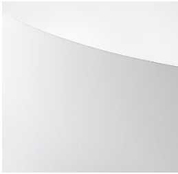
Alluminio alveolare lucido